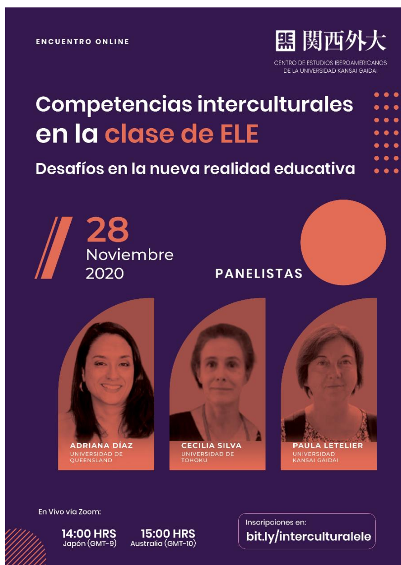
Cartel del Encuentro Online