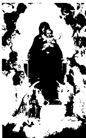
図5 アドルフ・ウィリアム・ブーグラー 《天使に囲まれる聖母》 1900年 油彩 カンヴァス 285×185cm プティ・パレ美術館蔵

バージェスの文章において、ブラック・アフリカの造形は「芸術」であると見なされ、西洋の人々がすでに芸術的価値を認めていたアジア、つまりオリエントと同等に扱われている。そしてその根拠として西洋的な「美しさ」とは異なる「醜さ」という新しい美の規範を挙げ、そこに西洋の芸術の再生の希望を託したのである。ここにブラック・アフリカの造形物に対する明らかな論調の変化を確認することができる。