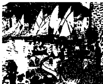
図3 アンドレ・ドラン《帆を乾かす舟》 1905年 油彩 カンヴァス 83×101cm プーシキン美術館蔵