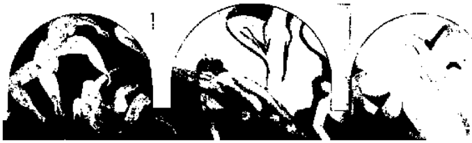
図10 アンリ・マチス パーンズの《ダンス》未完 1931年 油彩 カンヴァス 341×394cm (左) 351×498cm (中央) 335×391cm (右) パリ市近代美術館蔵

20年の後マチスが完成させたのは、フィラデルフィアにあるパーンズ財団のメイソン・ギャラリーを現在も飾っている新しい《ダンス》であった。ニューヨーク近代美術館の初代の館長であ