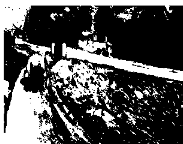
図4 モーリス・ド・ヴラマンク《父の庭にて》 1904-1905年 油彩 カンヴァス 50×65cm ベルグラード美術館蔵

小さな彫像を入手する 3) (図1)。マチスを中心とするこのグループは、前年のサロン・ドートンヌで、一様に