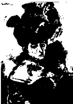
図2 アンリ・マチス《帽子の女》 1905年 油彩 カンヴァス 80.6×59.7cm サンフランシスコ近代美術館蔵