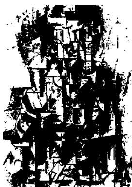
図7 パブロ・ピカソ 《バイオリンを持つ男》 1912年 油彩 カンヴァス 100×73cm フィラデルフィア美術館蔵

ゴールドウォーターが再定義したプリミティヴィズムが、先立つ言説の影響を受けて誕生したことは言うまでもない。彼自身もその認識に基づいて、自らの主張の、いわば血統を示すかのようにプリミティヴなるものをめぐる言説を、時代を追って列挙した。ゴールドウォーターにすれば、それは持論の正統性を示すためであったろうが、彼とは異なる視点で批判的に受け取ることを可能にしてくれる重要な部分でもある。ここでゴールドウォーターが先駆的研究として力を入れて挙げたのが、ヴィルヘルム・ヴォリンガーの『抽象と感情移入』である。