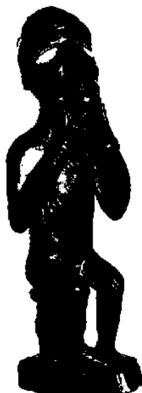
図1 ヴィリ族の人像 コンゴ共和国 木製 24cm高 個人蔵